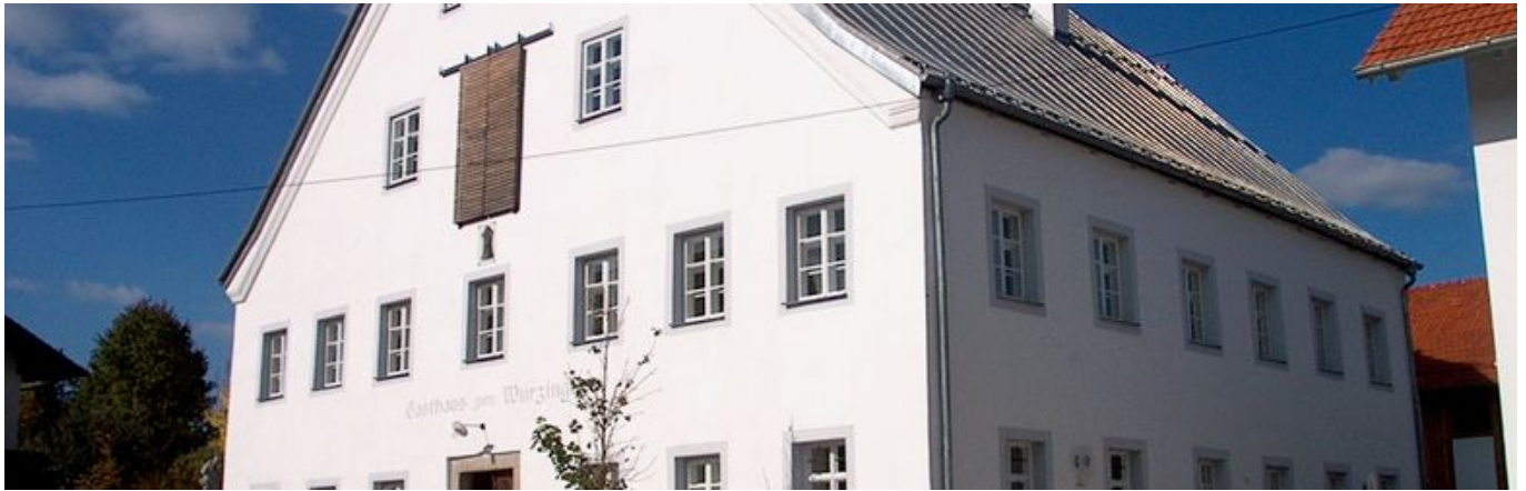
_ Infostelle "Würzinger Haus" in Außernzell

Der Naturpark Bayerischer Wald e.V. hat im Jahr 2003 zusammen mit der Gemeinde Außernzell und dem Landkreis Deggendorf im Dachgeschoss des Würzingerhauses eine Naturpark-Infostelle für den Landkreis Deggendorf eingerichtet. Die Ausstellung hat die Besonderheiten von Natur und Landschaft am Forchenhügel sowie die Aufgaben des Naturparks Bayerischer Wald e.V. zum Thema.