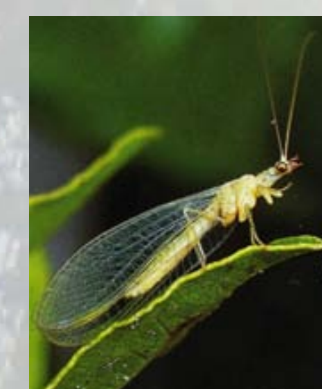
Gemeine Florfliege ( Chrysoperla carnea )

Die gemeine Florfliege wird aufgrund ihrer Augenfarbe auch „Goldauge“ genannt. Ihre Fühler sind mit einer Länge von bis zu 2cm ebenso lang wie ihr Körper. 1999 wurde die Gemeine Florfliege zum Insekt des Jahres gewählt.