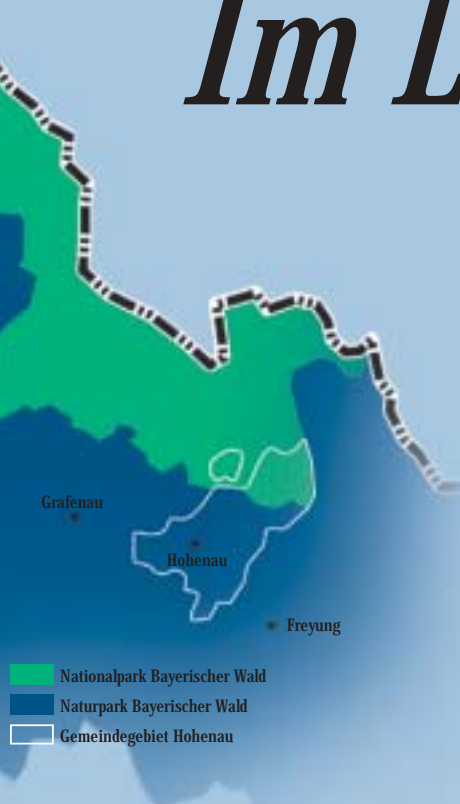
■ Nationalpark Bayerischer Wald ■ Naturpark Bayerischer Wald □ Gemeindegebiet Hohenau

Durchwandert der Besucher hingegen die offenen Feld- und Wiesenfluren um die Dörfer am Rande des „Großen Waldes“, lernt er die überaus reizvolle Kulturlandschaft des Naturparks Bayerischer Wald kennen. Die Erhaltung ihrer ungewöhnlich reichhaltigen Tier- und Pflanzenwelt durch eine traditionell naturnahe Landbewirtschaftung ist eines der Hauptanliegen im Naturpark. Daneben soll die malerische Landschaft als Grundlage für eine zukunftsweisende, „sanfte“ Form des Tourismus mit echter Erholungsfunktion bewahrt und genutzt werden.