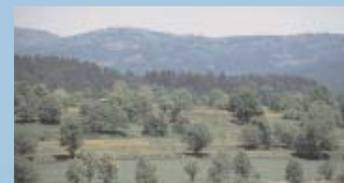
Natur aus Menschenhand, entstanden aus einer Jahrhunderte währenden Bodenkultur: ihre Vielgestaltigkeit bedingt den ökologischen Wert und den landschaftlichen Reiz weiter Bereiche des Naturparks Bayerischer Wald.