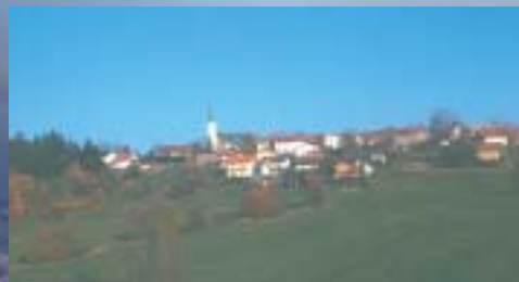
Der Ort Hohenau wurde bereits vor mehr als 600 Jahren auf einer von sumpfigen Auengründen umgebenen Geländekuppe an der „Schnittstelle“ zwischen dem heutigen Nationalpark und Naturpark gegründet.